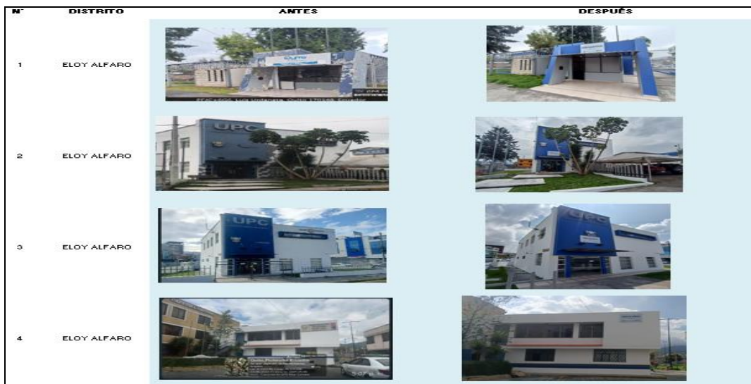
Imagen 8. Unidades de Policía Comunitaria Rehabilitadas