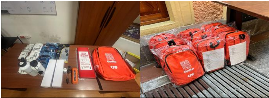
Imagen 27. Kit para evacuación