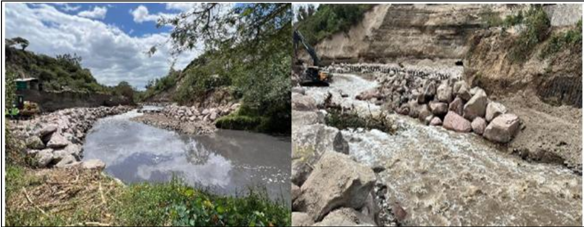
Imagen 19. Obra de mitigación de riesgo en el Río Machángara - Tramo III