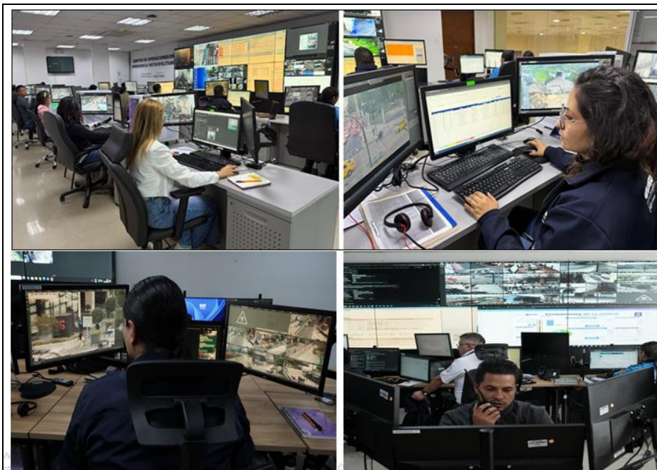
Imagen 1. Monitoreo, videovigilancia y coordinación operativa - Sala de Situación

Las imágenes que se muestran a continuación, evidencian algunas de las acciones que llevó a cabo la EP EMSUGURIDAD durante el año 2025: