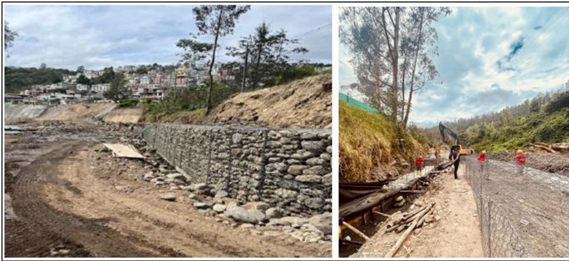
Imagen 22. Obra de Estabilización de taludes ubicados al sureste del Balneario Cunuyacu