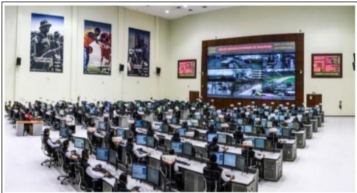
Imagen 26. Sala del SIS ECU 911