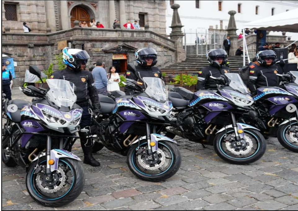
Imagen 10. Entrega de prendas de protección