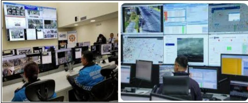
Imagen 3. Mantenimiento preventivo a los equipos de CCTV implementados en los mercados y espacios públicos del DMQ