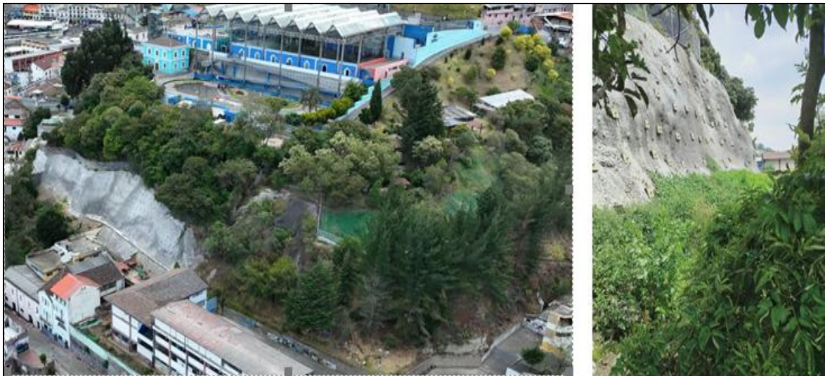
Imagen 14. Obra de estabilización de taludes ubicados al sureste del Complejo Deportivo Pepe Flores y conducción de aguas del Barrio El Panecillo