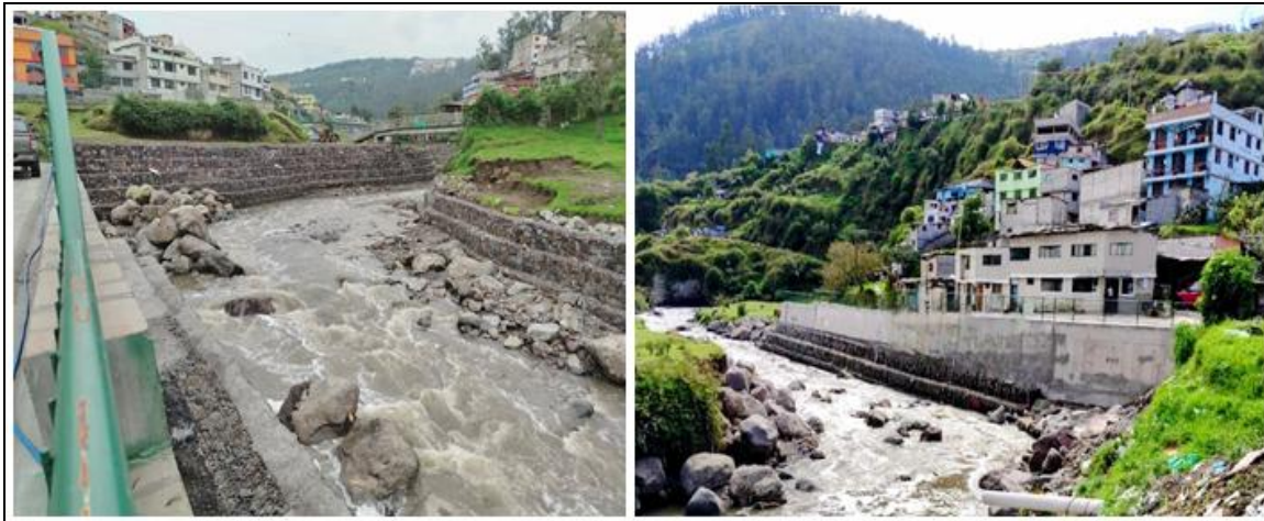
Imagen 20. Obra de mitigación de riesgo en el Río Machángara - Tramo II