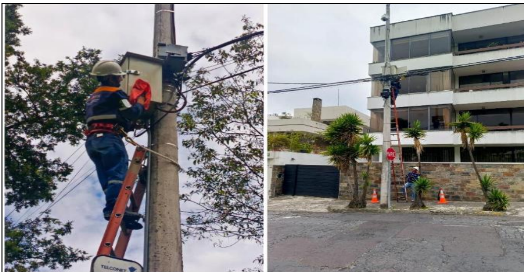
Imagen 4. Centrales de Alarmas comunitarias