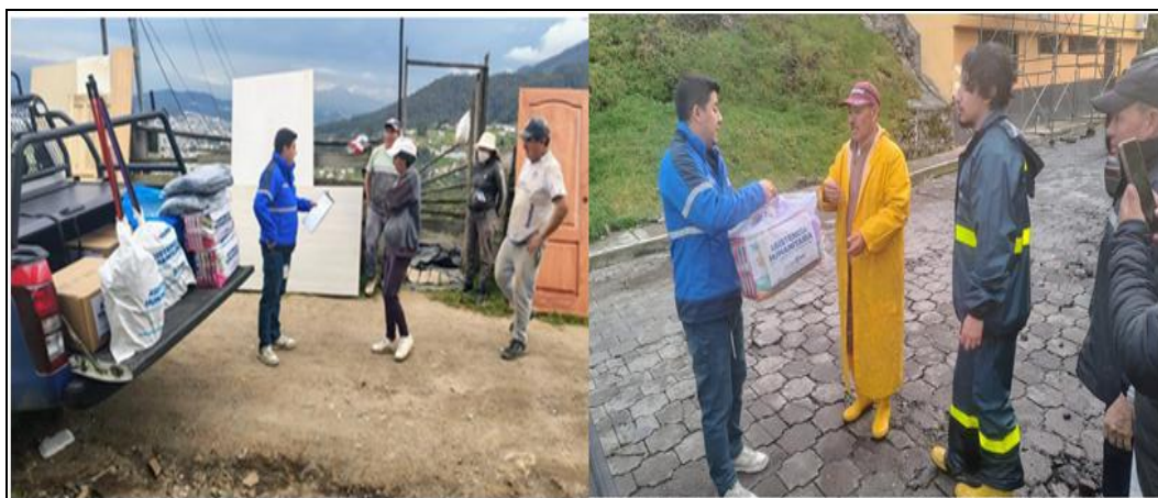
Imagen 24. Entrega de Ayudas Humanitarias