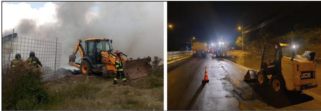
Imagen 25. Ayuda con Maquinaria Pesada