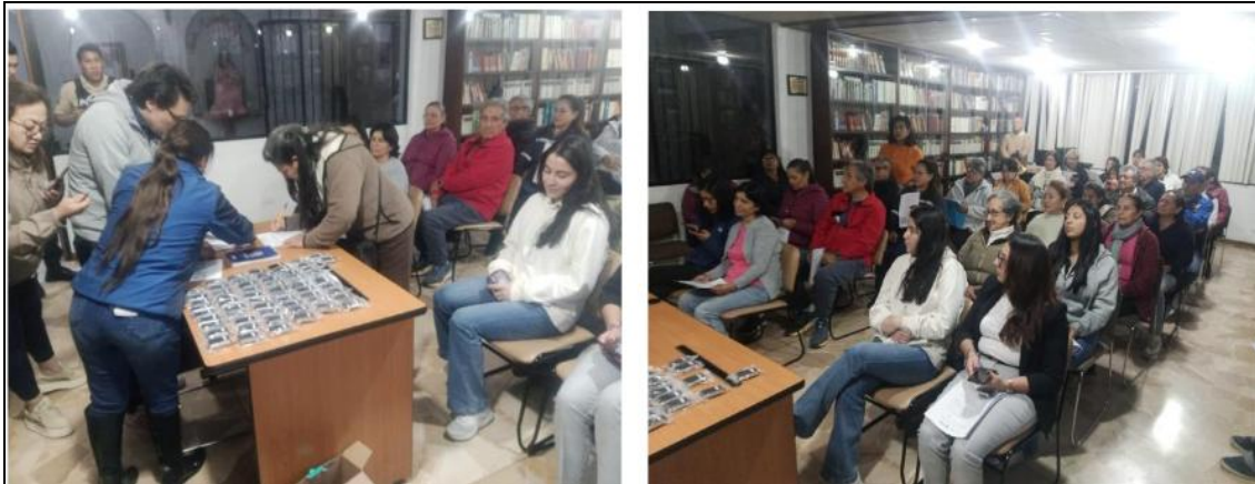
Imagen 6. Implementación de un punto de Monitoreo y Alertas en el Sector la Comuna