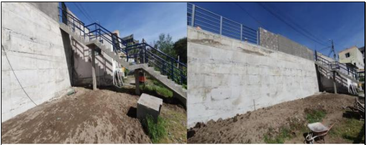
Imagen 17. Obra de estabilización de taludes ubicados al sureste de la Cancha Liga Barrial La Libertad de Chillogallo