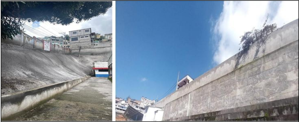
Imagen 16. Obra de estabilización de taludes ubicados al este del Parque La Capilla y conducción de aguas del Barrio La Capilla